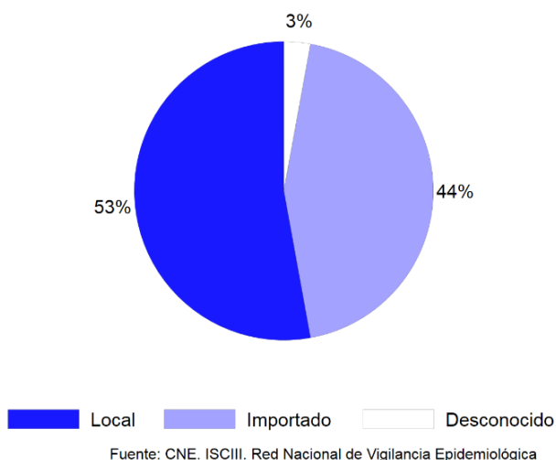
Figura 3. Origen de los casos de COVID-19 en España, importados y locales (N=229)

De los 229 casos analizados, el 59% han adquirido la infección a nivel local y el 41% son importados (Tabla 2 y Figura 3).